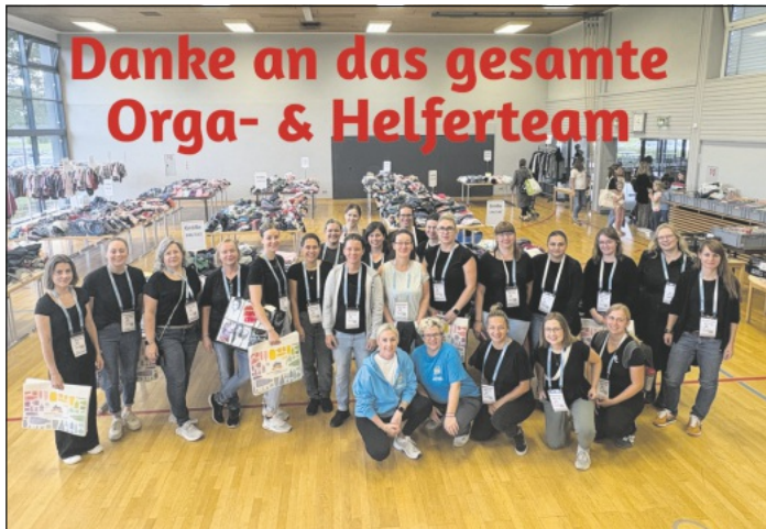
Im Bild: Das Helferteam von Sonntagvormittag. Nur ein kleiner Teil der gesamten Helfermannschaft.

Die Tagesfahrt ist ausgebucht - der Bus ist voll! Danke für die zahlreichen Anmeldungen!