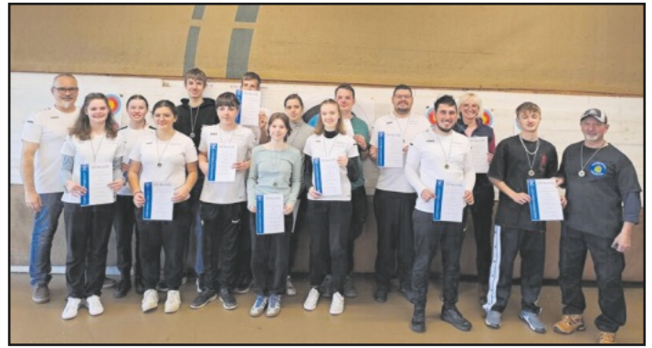
Schützinnen und Schützen der Vereinsmeisterschaft

Los ging es um 9:30 Uhr mit dem Einschießen, um nach 9 Pfeilen dann mit den 60 Wertungspfeilen durchzustarten. Danach konnten wir dann zur abschließenden Siegerehrung übergehen. Wir bedanken und beim Vorstand und den Trainern für die gute Organisation und drücken allen bei der nun folgenden Kreismeisterschaft die Daumen.