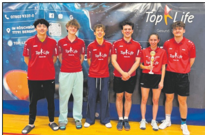
Links die U19 II und rechts die U19 I

Auch die U15 war beim Final Four vertreten, welches für die Jugend U15 in Seelbach stattfand. Gegen zwei sehr starke Gegner musste das Team zunächst zwei Niederlagen hinnehmen. Im anschließenden Spiel um Platz 3 trafen sie dann auf die Mannschaft aus Ringsheim. In dieser spannenden Begegnung verlor die U15 II am Ende leider knapp mit 3:4 und belegte somit den vierten Platz. Trotz der Ergebnisse war es insgesamt eine starke Leistung aller drei Mannschaften, die sich beim Final Four mit viel Einsatz und Teamgeist präsentierten.