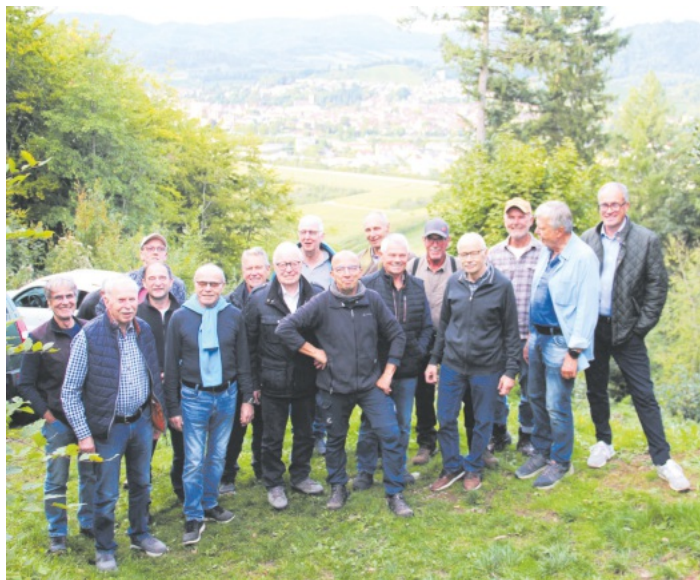
Zur Konzertvorbereitung gehörte auch ein kameradschaftliches Zusammensein auf der Hotzenplotz-Hütte.