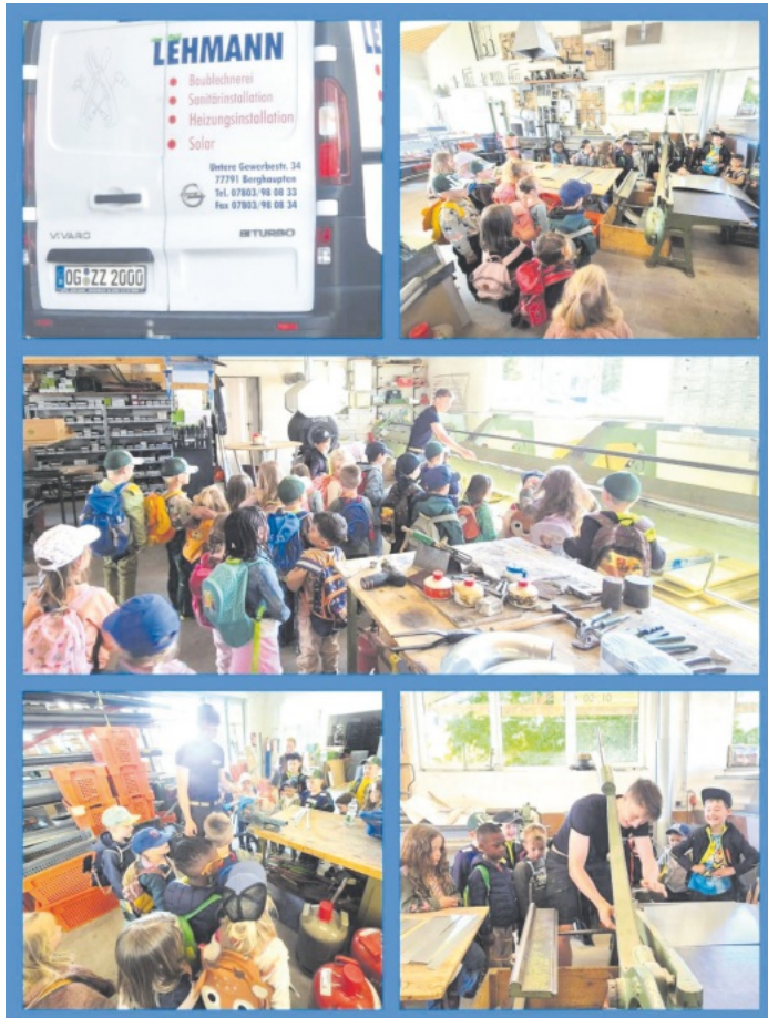
Kita Kinder zu Besuch bei der Blechnerei Lehmann

Vielen lieben Dank an die Firma Lehmann für die Zeit, alle hatten sehr viel Spaß. Es war sehr schön bei euch.