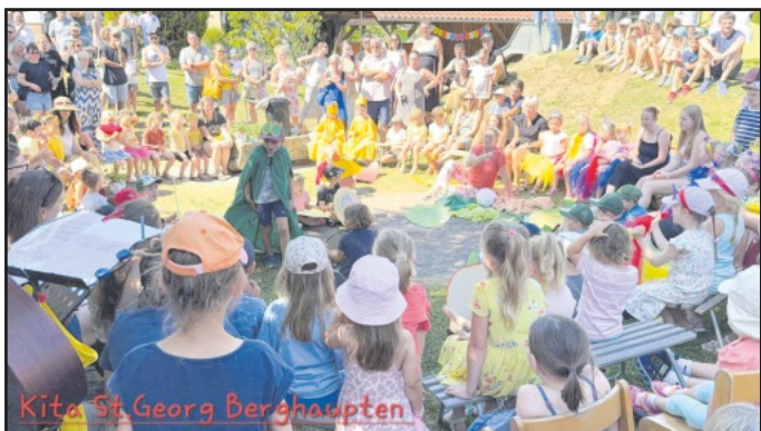
Die Raupe Nimmersatt beim Kita-Fest

Silke Laug und das Team der Kita Sankt Georg